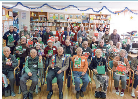
松溪ふれあいの家でクリスマス会を楽しむご利用者のみなさん